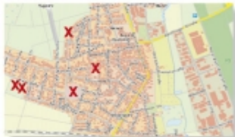
SPD-FRAKTION UND FREIZEITLAGEN IM ORTSTEIL ZEILANGEN