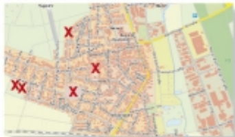
SPIELPLÄTZE UND FREIZEITLAGEN IM ORTSTEIL ZEILANGEN